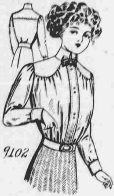
9102. Dámský živůtek "Joch". Střih v 6 mírách: 32, 34, 36, 38, 40 a 42 paleů míra v prsou. Jest třeba 2 1/4 yardu 36-paleové látky pro 36-paleovou velikost.