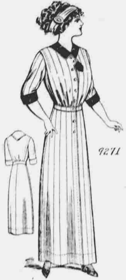
9271. Domácí úbor pro dámy. Střih v 6 mírách: 32, 34, 36, 38, 40 a 42 paleů míra v prsou. Jest třeba 5 yardů 44-paleové látky pro 38-paleovou velikost.