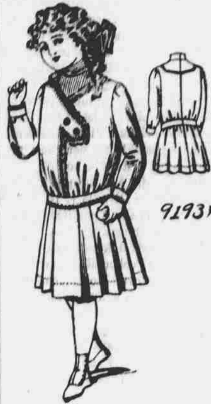
9193. Oblek pro děvčata. Střih ve 4 mírách pro 6, 8, 10 a 12-leté. Jest třeba 4 1/4 yardu 27-paleové látky pro osmileté.