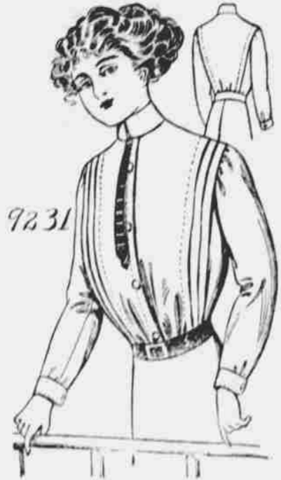
9231. Dámský živůtek. Střih v 6 mírách: 32, 34, 36, 38, 40 a 42 palců míra v prsou. Jest třeba 3 1/2 yardů 24-palcové látky pro 36-palcovou velikost.