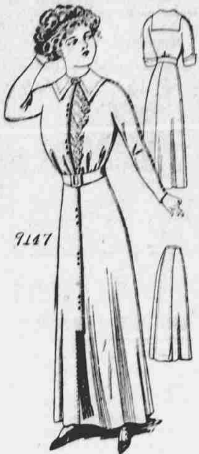
9147. Dámský úbor 'Polo Princess'. Střih v 5 mírách: 34, 36, 38, 40 a 42 palců míra v prsou. — Jest třeba 6 3/4 yardů. 40-palcové látky pro velikost 36-palcovou.