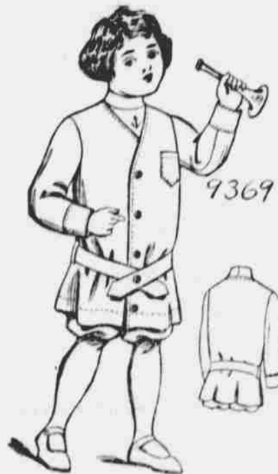
9369. Ruské obleky pro hochy. Střih ve 4 mírách pro 3, 4, 5 a 6 leté. Jest třeba 3 1/4 yardů 44-palcové látky pro 6-leté hochy.