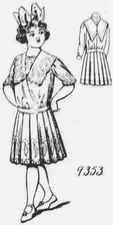
9353. — Šaty pro dívky. — Střihy ve 4 mírách: 6, 8, 10 a 12 let. Jest třeba 4 yardy 36-palcové látky pro 8 let.