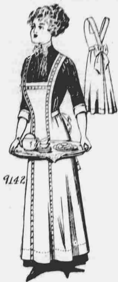
9142. Zástěra pro dámy. — Střih ve 3 mírách: malá, střední a velké. Jest třeba 3 a 3 osminy yardu 36-palcové látky pro střední velikost.