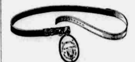
Průtrzní pásy všech velikostí a druhů od $1.00 výše. Perko- latory pro úsporné vaření nej- chutnější kávy. 50-ť

Major Holas domluvil, hladě si knír. — V hlasu majorově bylo ticho. Jen ozdobné barokové ho- diny na mramorové desce secesní- ho stolku jasným hlasem odbíjely jednu po půlnoči.