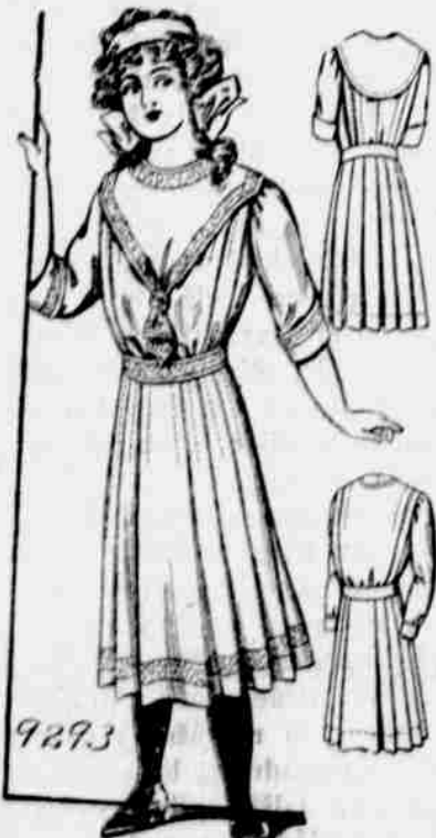
9293. — Šaty pro dívky. — Čtyři velkosti, pro 8, 10, 12 a 14-leté. Jest třeba 3 1/2 yardu 44-palcové látky pro 10-leté.

Každý, kdo sobě předplatí na některý z našich listů, obdrží jeden módní vzorek — stříh úplné sádky. Další vzorky za 10c jeden.