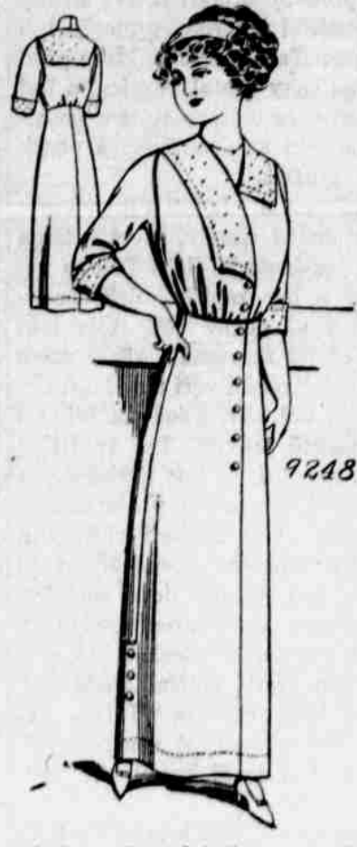
9248. — Damské šaty. — Velkosti 32, 34, 36, 38, 40 a 42 palců v prsou. Jest třeba 6 yardů 36-palcové látky pro velkost 36-palcovou.