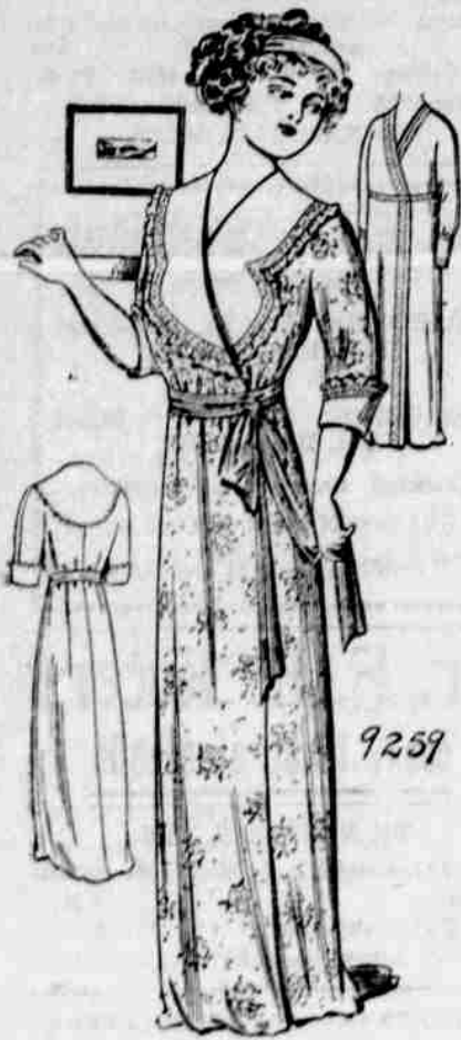
9259. — Damské kimono. — Velkosti: Malá, prostřední a velká. Jest třeba 6 3/4 yardu 36-palcové látky pro prostřední velkost.