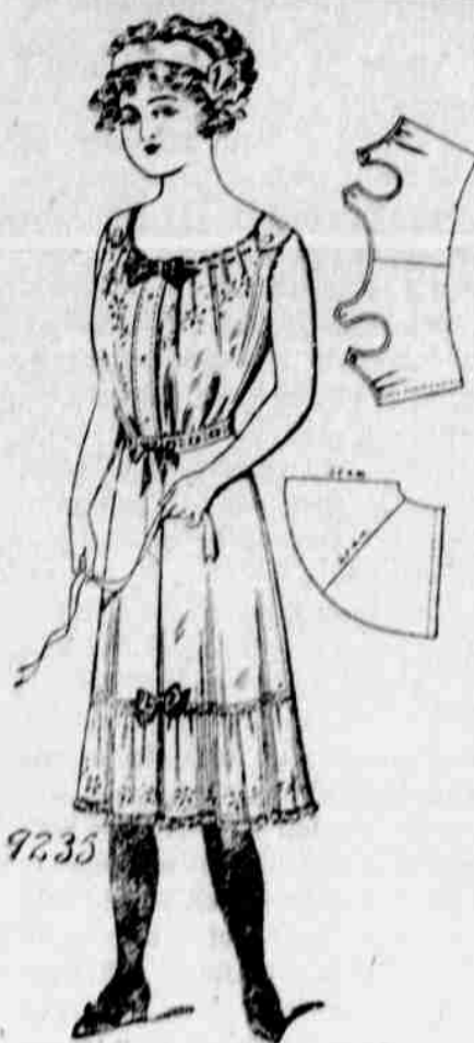
9235. — Damský úbor — spodní živůtek a sukně — Velkosti: Malá, prostřední a velká. Jest třeba 3/8 yardu 36-palcové látky pro prostřední velkost.