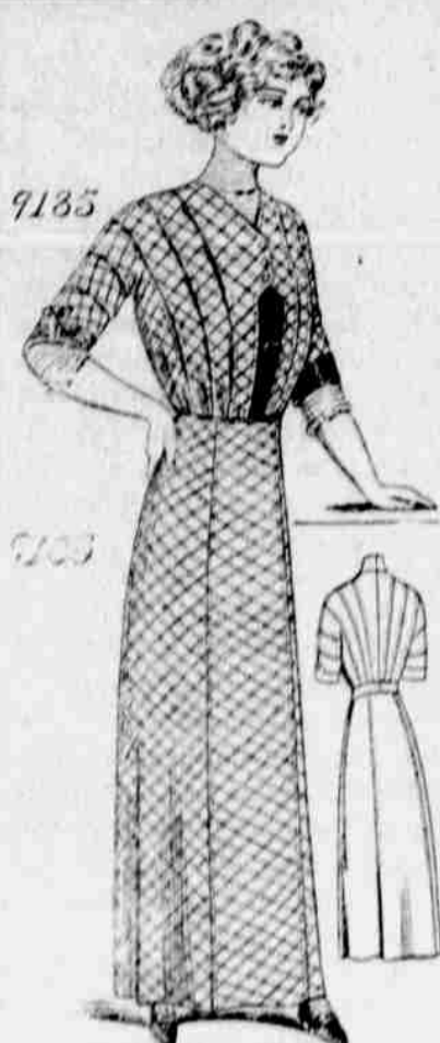
9185 — 9183. — Damský oblek. Živůtek 9185, velikosti: 34, 36, 38, 40 a 42 palců v prsou.