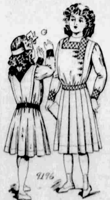
9196. — Šaty pro dívky (s yoke). — Velkosti pro 6, 8, 10, 12 a 14leté. Jest třeba 4 yardy 44-palcové látky pro 10letou.