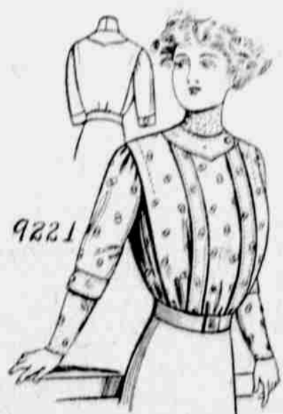
9221. — Damský živůtek. — Velkosti: 32, 34, 36, 38, 40 a 42 palce v prsou. Jest třeba 2 1/2 yardu 40-palcové látky pro velkost 36-palcovou.