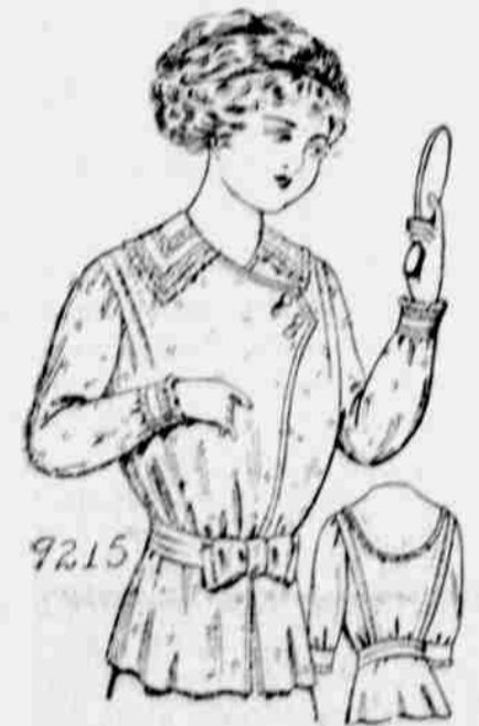
9215. — Damská parádní planda (dressing sack). — Velkosti: 32, 34, 36, 38, 40 a 42 palce v prsou. Jest třeba 2 1/2 yardu 40-palcové látky pro velkost 36-palcovou.