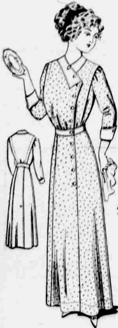
9161. — Damské domácí šaty.

Velkosti pro 6, 8, 10 a 12leté. Jest třeba 3 1/4 yardu 44-palcové látky pro šleťou.