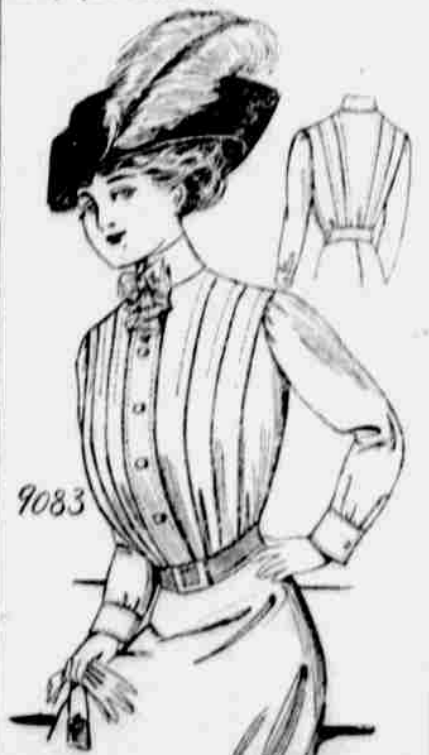
9083. — Damský "shirt waist".

Každý, kdo sobě předplatí na některý z našich listů, obdrží jeden módní vzorek — stříh úplné zdarma. Další vzorky za 10c jeden.