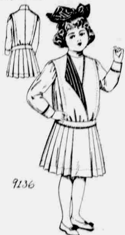
9136. — Šaty pro děvčátka.

Velkosti: 22, 24, 26, 28 a 30 palců v pasu. Jest třeba 4 1/4 yardu 44-palcové látky pro velikost 24-palcovou.