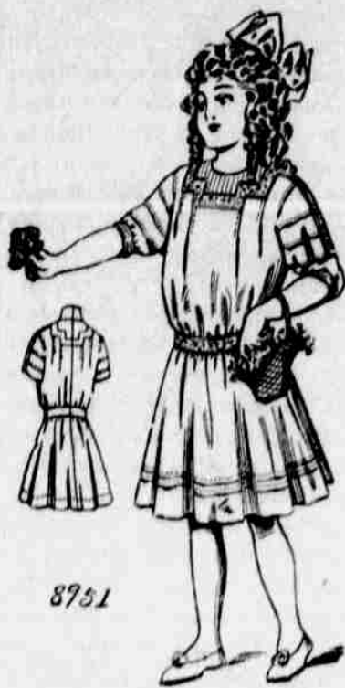
8751. — Šaty pro dívky.

Velkosti pro 6, 8, 10 a 12leté. — Jest třeba 3 yardy 36palcové látky pro 6-letou, s 5/8 yardu na "tucker".