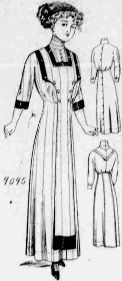
9095. — Damské domácí šaty. Velikosti: 34, 36, 38, 40, 42 a 44 palce přes prsa. Jest třeba 8 yardů 36-palcové látky pro velikost 38 palců s vložkou a 6 yardů bez vložky.