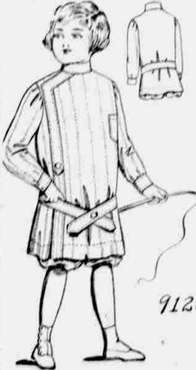
9126. — Oblek pro chlapce. — Velikosti pro 3, 4 až 6leté. Jest třeba 3 yardy 44-palcové látky pro 4 roky starého.