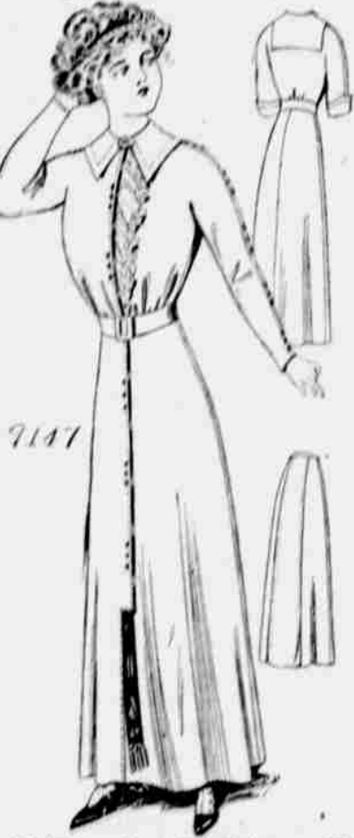
9147. — Damské šaty. — Velikosti: 34, 36, 38, 40 a 42 palce přes prsa. Jest třeba 6 3/4 yardu 40-palcové látky pro velikost 36 palců.