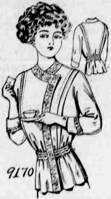
9170. — Damská parádní planda (dressing sack). — Velikosti: 32, 34, 36, 38, 40 a 42 palce přes prsa. Jest třeba 4 1/4 yardu 36-palcové látky pro velikost 38 palců.