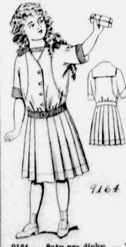
9164. — Šaty pro dívky. — Velikosti pro 8, 10, 12 a 14leté. Jest třeba 4 1/4 yardu 36-palcové látky pro 12leté.

Každý, kdo sobě předplatí na některý z našich listů, obdrží jeden módní vzorek — stříh úplně zdarma. Další vzorky za 10c jeden.