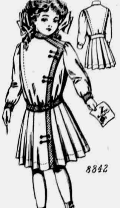
Čís. 8842. — Dívčí úbor. — Velikost pro 6, 8, 10 a 12leté. Je třeba 3 1/2 yardu 36 pale. látky pro 10leté.