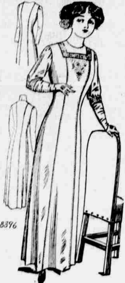
Čís. 8896. — Dámský "Princes" úbor. Velikost: 32, 34, 36, 38, 40 a 42 palců přes prsa. Je třeba 5 1/2 yardů 44 pale. látky pro 36 pale. velikost.