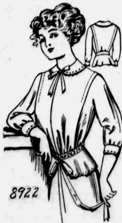
Čís. 8922. — Dámské sako. — Velikost: Malá, střední, velká. Je třeba 2 3/4 yardu 24 pale. materiálu pro střední velikost.