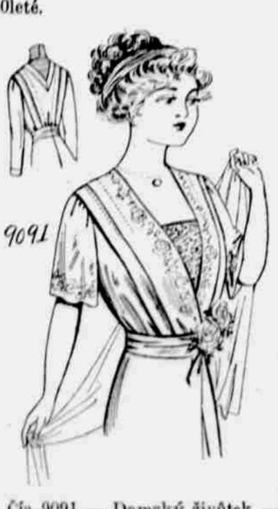
Čís. 9091. — Dámský živůtek. — Míra: 34, 36, 38, 40 a 42 palců přes prsa. Je třeba 2 yardy 36 pale. látky pro střední velikost, se 2 3/4 yardu podšívky 27 pale. šifříky.

Každý, kdo sobě předplatí na některý z našich listů, obdrží jeden módní vzorek — stříh úplně zdarma. Další vzorky za 10c jeden.