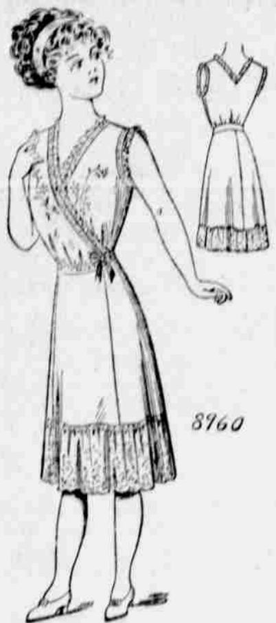
Čís. 8960. — Dámská "surplice" korsetová halenka se sukní. Velikost: malá, střední, velká. Je třeba 3 yardy 36 pale. látky pro střední míru.