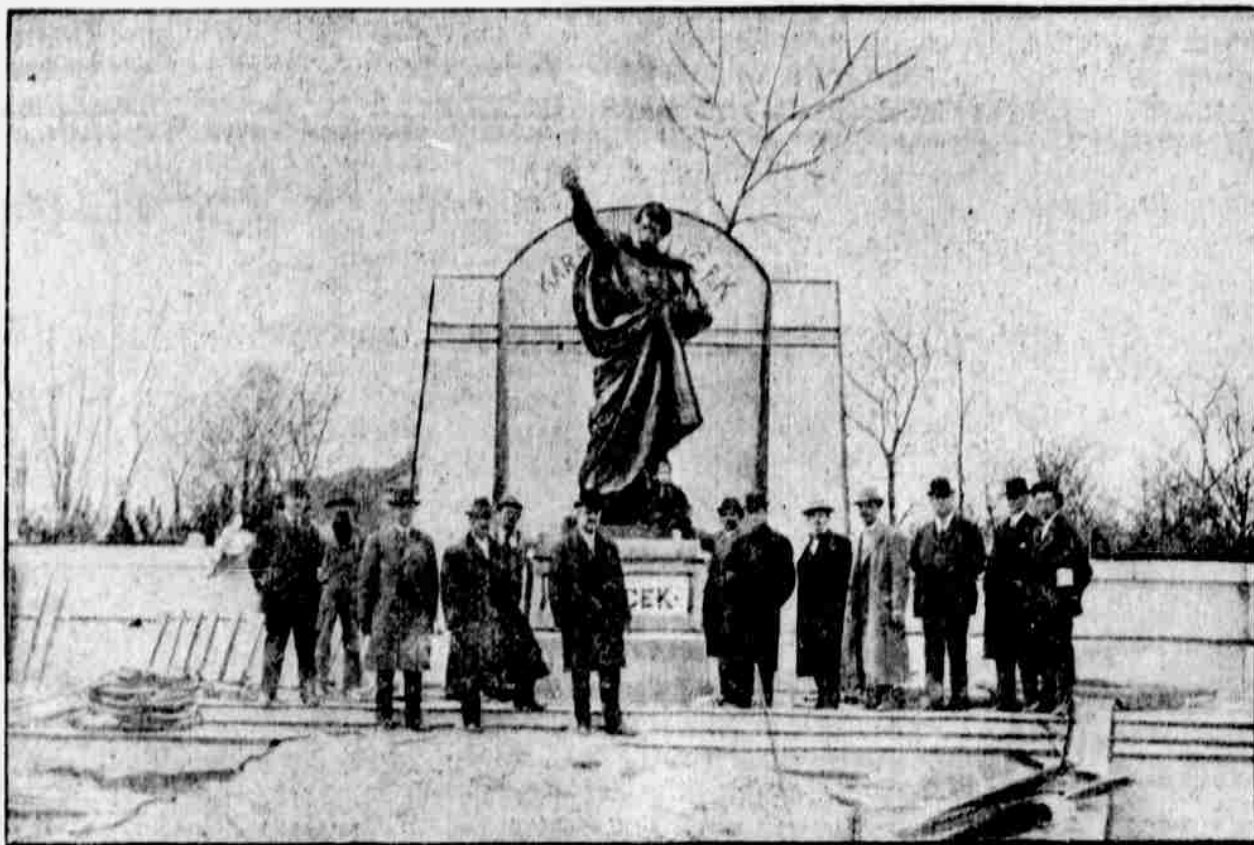
POMNÍK KARLA HAVLÍČKA BOROVSKÉHO PŘI VZTYČENÍ.

Zapůjčeno laskavostí denníku "Svornosti."