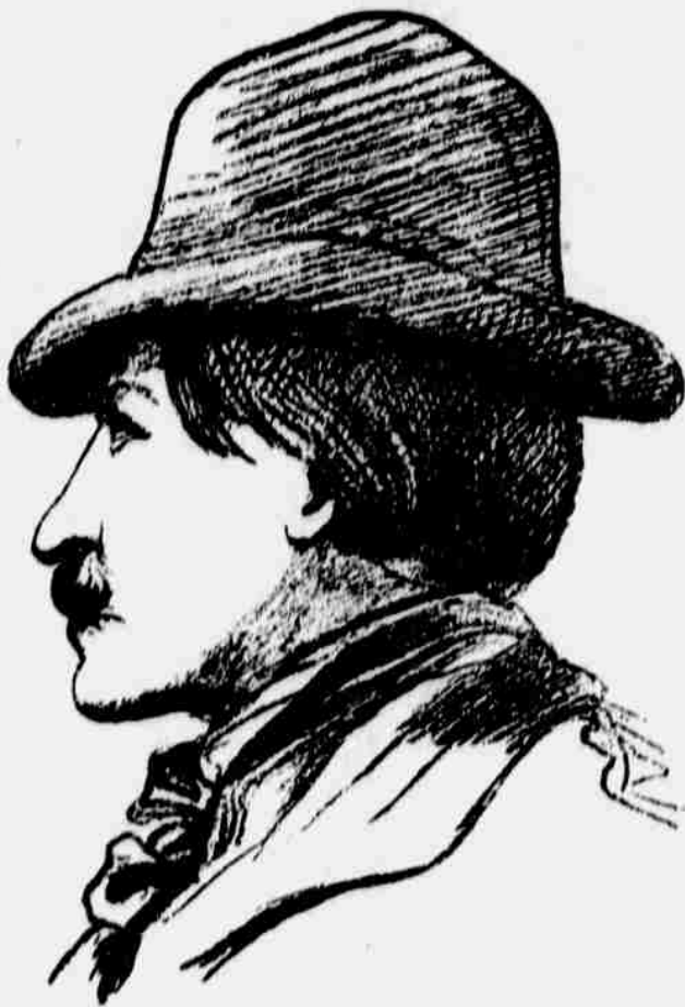
KAREL HAVLÍČEK BOROVSKÝ.