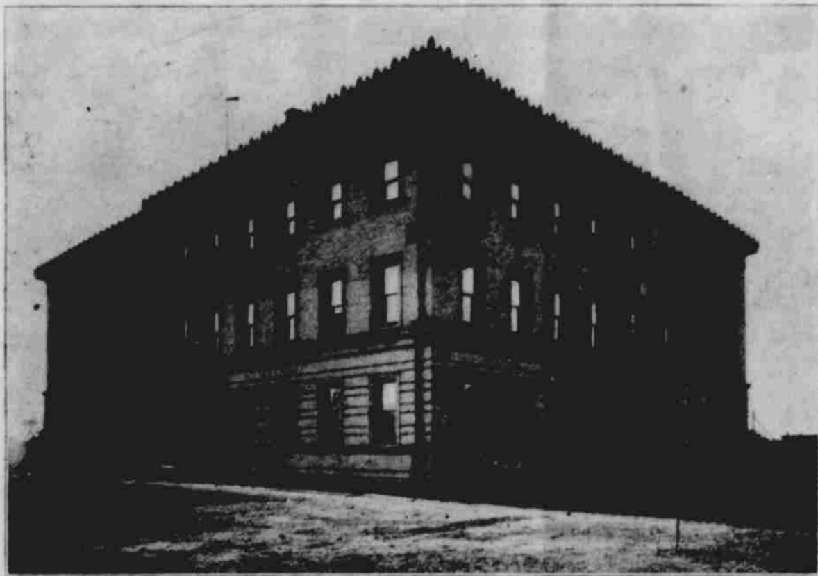
BRACE LABORATORY OF PHYSICS. (Pracovna pro fyzické pokusy.)