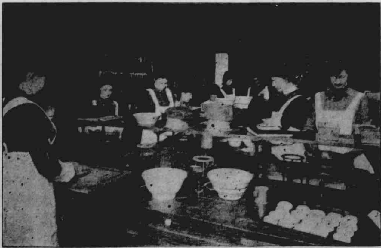
VÝJEV Z HOSPODYŇSKÉ ŠKOLY.