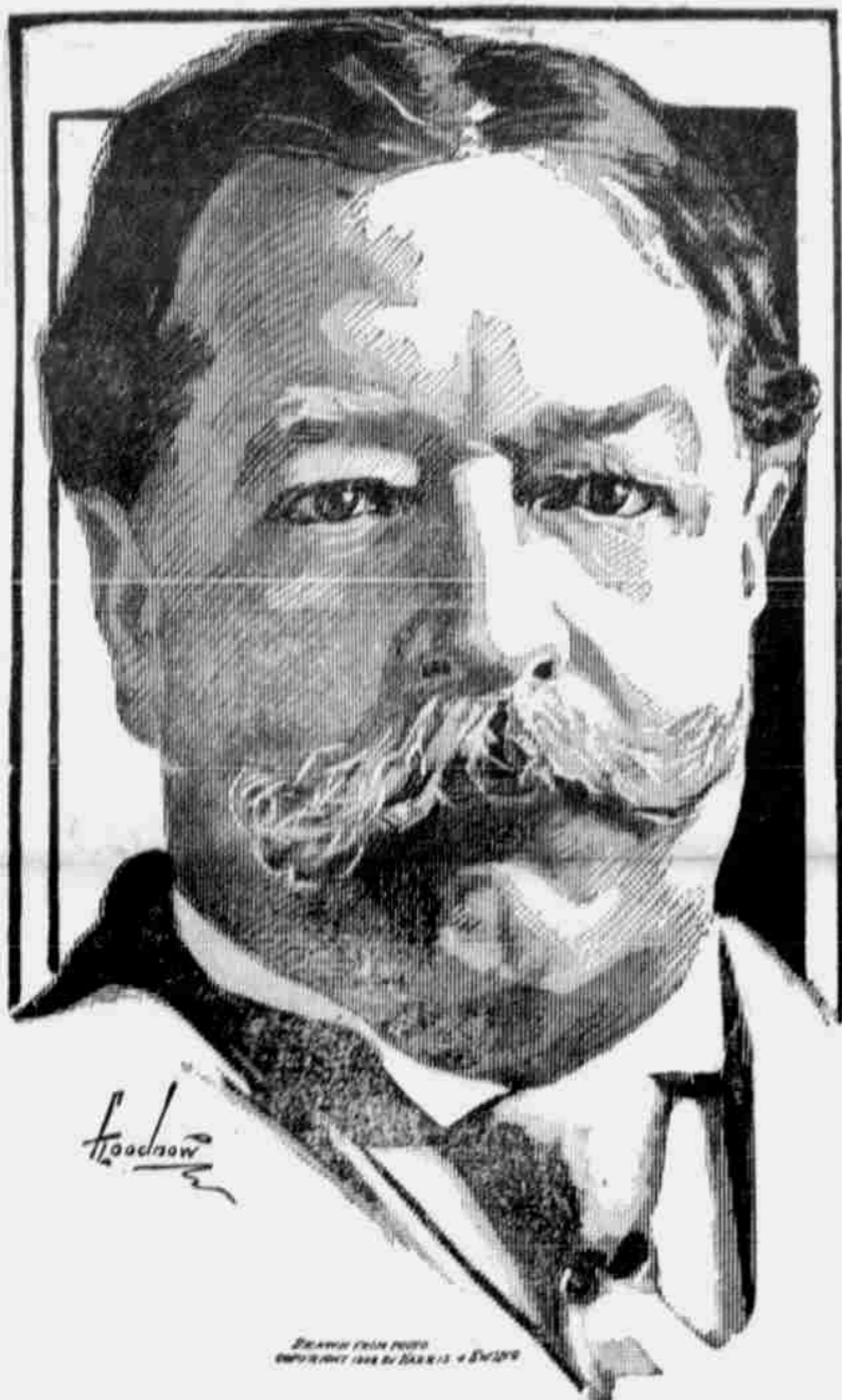
William H. Taft.