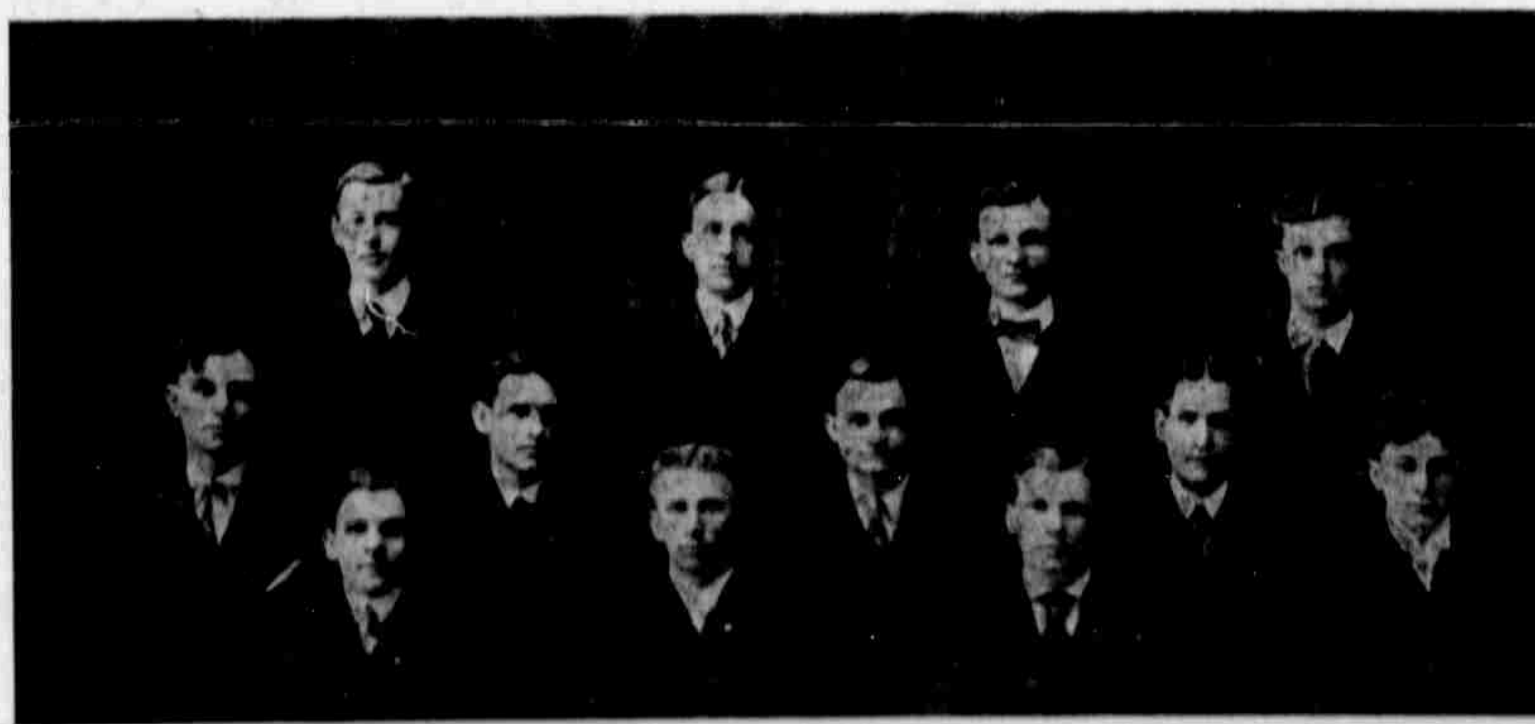
Úředníci a výborci Vzdělavacího Klubu Komenského, číslo I., v Lincoln, Nebraska.

Pozor:—Mnoho kořalen zde připravuje obyčejná hořká vína, s vymyšleným jménem "doktora" a lidí tím šálí. Žádejte všude jen Koubovo Karlovarské Medové, vyráběné v Coloradu anebo pošlete si pro bedničku za $3.00 na adresu: A. V. Kouba, 2819-21 Larimer Str., Denver, Colo.