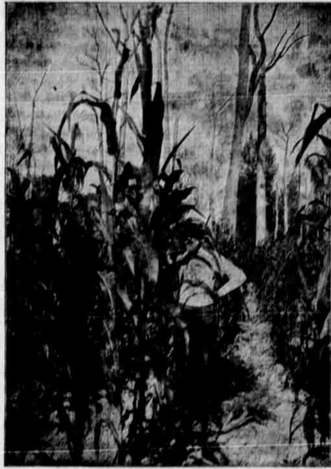
Korna vzrostlá na poli druhý rok po vykácení stromů v Yazoo údolí.

Jižané přišli k poznání, že chudoba Jihu má původ svůj v tom, že tolik půdy jeho leží nevdělané. Čím by byl západ bez pilných, energických rukou přistěhovalců? Tito rozkvět a bohatství západu vytěží z půdy jimi vzdělané a Jih mohl by býti tak bohatým, tak zkvétajícím jako západ, kdyby jen měl dosti lidí s pilnými, pracovitými rukama, kteří by se na těch lánech ladem ležící půdy sadili a ji vzdělávali.