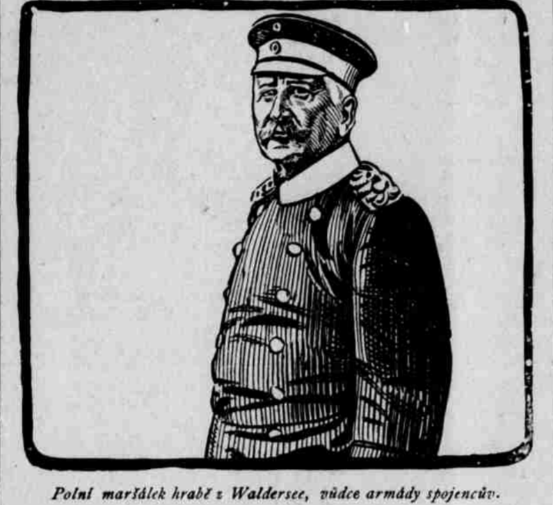
Polní maršálek hrabě z Waldersee, vůdce armády spojenců.