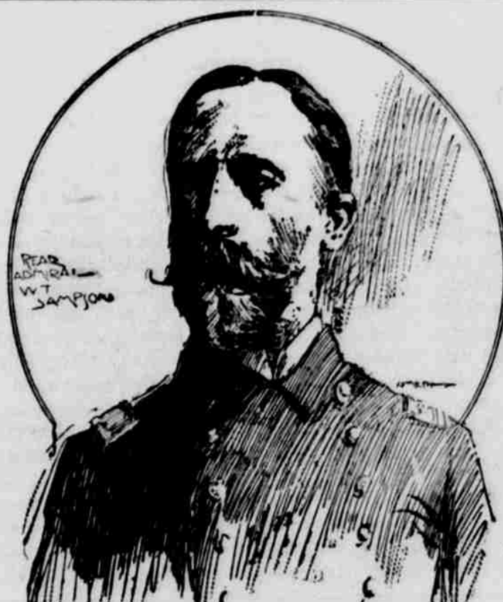
POD-ADMIRÁL W. T. SAMPSON, velitel Akadrony severo-atlantické, jest pravým vzorem důstojníka námořního a těší se důvěře a oblibě všech, kdož do styku s ním přichází