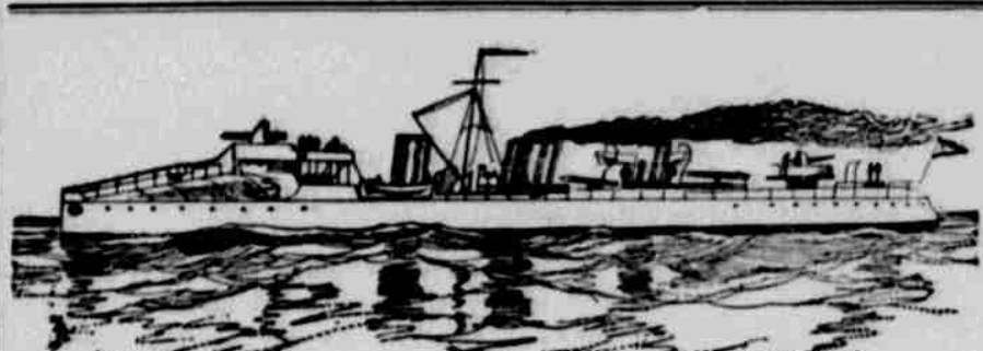
PROTITORPÉDOVÁ LODICE FUROR.

Manifestace českého národního dělnictva v Praze konala se o velkonocních svátcích na Králov. Vinohradech. Delegáti českých dělnických spolků z Čech, Moravy i ze Slezska počtem 600 projednali tu svou organizaci a prohlásili se národně pro společný postup s národem, v ohledu odborném pak postavili se sic samostatně, ale vyloučili třídní boj, kterým internacionála sociální chtěla zámožné vrstvy vyhladiti a — sama jejich posici zaujati. Tímto usnesením manifestovalo se národní dělnictvo co uvědomělá, politicky vyspělá organizace a tím zabezpečila si též svou existenci, která již nyní má převahu nad internacionálou, jež do roka bude as úplně rozprášena.