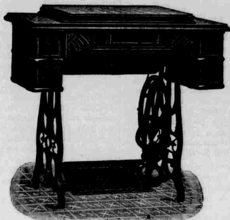
DROP HEAD CABINET ČÍS. 4.

Jelikož pečujeme vždy o to, aby našim čtenářům a odběratelům dostalo se vždy to nejlepší a nejnovější, proto s potěšením sdělujeme, že jsme učinili opatření takové, abychom mohli šicí stroje tohoto druhu "naším odběratelům poskytovat a sice za cenu až úžasně nízkou, vzhledem ku obyčejné ceně krámské. Drop-head cabinet stroje prodávány jsou jednotlivě za $65 hotové aneb za $75 na splátku. My obstaráme našim předplatitelům "drop head cabinet" stroj Pokrok Západu, se zaručením úplné spokojenosti a vrácením peněz do třiceti dnů, když by se nelíbil, jak následuje: