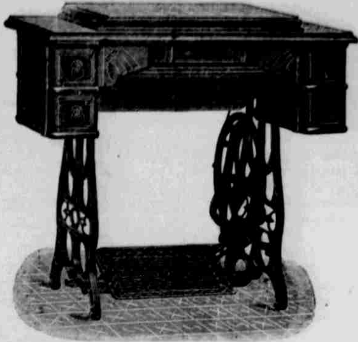
DROP HEAD CABINET Čís. 4.

Jelikož pečujeme vždy o to, aby našim čtenářům a odběratelům dostalo se vždy to nejlepší a nejnovější, proto s potěšením sdělujeme, že jsme učinili opatření takové, abychom mohli šicí stroje tohoto druhu našim odběratelům poskytovat i sice za cenu až úžasně nízkou, vzhledem ku obvyklé ceně krámské.