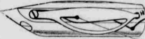
Stroj opatřen jest samosazovací jehlou, tak že bez jakékoli zvláštní pozornosti tato vady do pravého místa usazena jest. Ten opatřen jest samonárodním navíječem. Vřetenko se do těloho zavedí a nitě sama se pravidelně navíjí, pohybem polybováním šlapadla. Vůbec, v každém člku du jest seřízení stroje co nejdokonalější.

Tyto stroje neprodáváme komukoliž, nřbřž pouze jen našim odběratelům, starým i novým. Proto neudáváme cenu jinou, než takovou, v které jest již zahrnuto předplatné na Pokrok Západu a Knihovnu Americkou a nabídnáme stroj "POKROK ZÁPADU" se následující ceny, v nichž jak možno již předplácí na týdeník Pokrok Západu a Knihovnu Americkou zahrnuto: