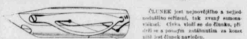
Stroj opatřen jest samouzavíracím jehlovým, tak že bez jakékoli zvláštní pozornosti tato vždy do pravého místa nenauzena jest. Tež opatřen jest samojízdným navíjákem. Všeteno se do této zrcadla a ně sama se pravidelně navíjí, pohybem polybovávacím šlapadla. Všeob, v každém ohledu jest seřízen stroj co nejdokonalěji.

Vyobrazení vedlejší ukazuje vnitřní seřízení stroje, kteréž na první pohled musí každému znázornit odlišnou podobu jeho jednoduchosti, která zaručuje trvanlivost.