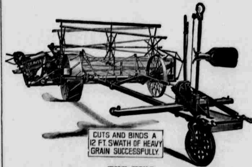
CUTS AND BINDS A 12 FT. SWATH OF HEAVY GRAIN SUCCESSFULLY.