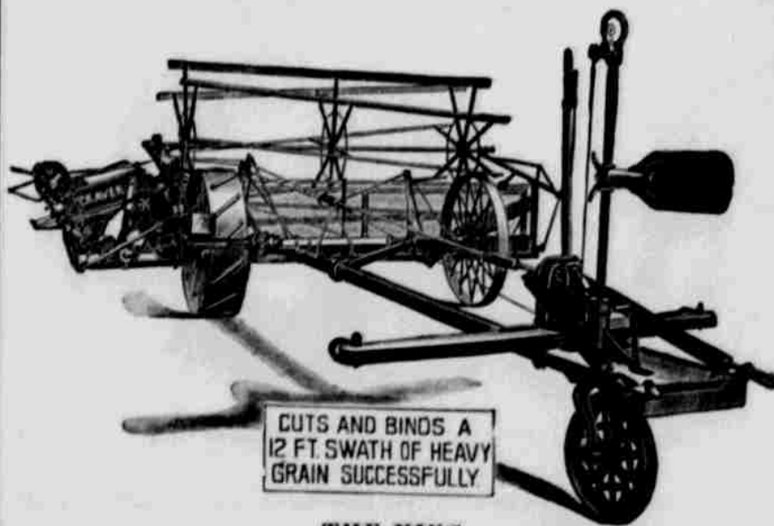
CUTS AND BINDS A 12 FT. SWATH OF HEAVY GRAIN SUCCESSFULLY.