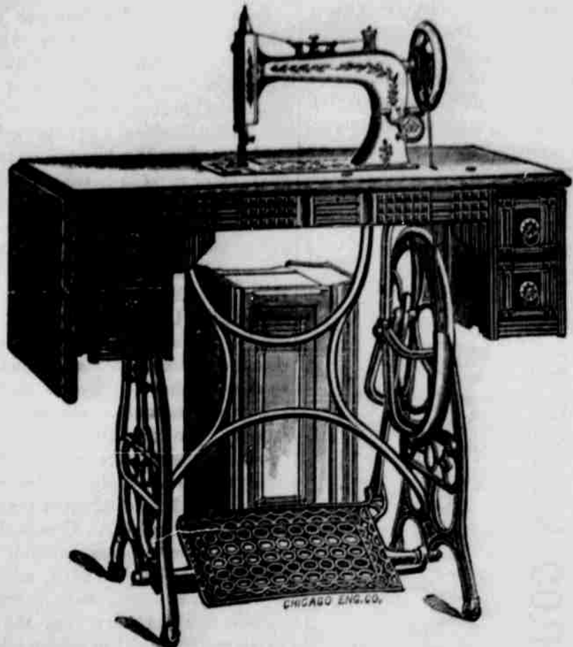
V boješím vyobrazení podáváme pohled na stroj "Pokrok Západu" č. 4. Stroje tyto jsou zhotoveny co nejdokladněji, zručnými řemeslníky, z nejlepšího materiálu a elegantní úpravy.

Z toho samého jest již zřejmo, že stroje, jež nabízáme, nejsou snad nedokonalé a proto jen levné, nýbrž že se nejdokonalejším vyrovnají. Ze poskytnutí je našim předplatitelům tak levně, to zveřejniti je snadno. Poskytnutím je totiž za cenu tovarů bez obyčejného trojnásobného výděleku státního, místního a podomního jednatele, kteří všichni chci z výděleku šití. My však neprodáváme stroje na výdělek, nehlédáme v tom živobytí, nýbrž chceme jen našim odběratelům prostředky proto poskytnouti stroje bez výděleku za ceny tovarů.