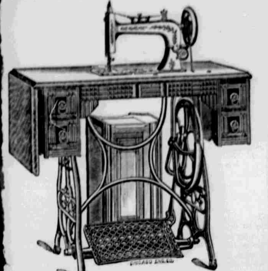
V nejlépe vyobrazené podáváme pohled na stroj "POKROK ZÁPADU" č. 4. Stroj je to zhotovený z nejdokonalých, zručných kovářských, z nejdokonalých materiálů a elegantní úpravy.

Šicí stroj je to, co každé ženě umožňuje, aby se sama oblékla a aby se také oblékla ostatním. Šicí stroj je to, co každé ženě umožňuje, aby se sama oblékla a aby se také oblékla ostatním. Šicí stroj je to, co každé ženě umožňuje, aby se sama oblékla a aby se také oblékla ostatním.