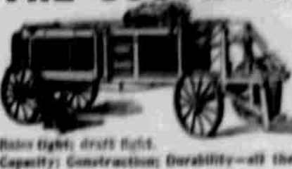
Build light, draft light. Capacity: Construction Durability—all the BEST.