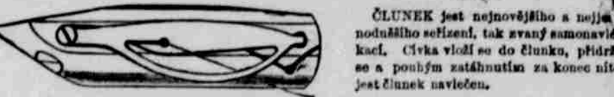
ČLUNEK jest nejnovějšího a nejvyššího podáního seřazení, tak zvaný samonavigační. Čívka vloží se do člunku, přidrží se a pohybem zatáhnutím za konec nitě jest člunek navlečen.

SVRŠEK, totiž číst obsahující hlavní pracující část stroje, zapuštěn jest svou spodní plochou do stolu, tak že plocha se stolkem tvoří jednu rovinnou. Vyobrazení vedlejší ukazuje vnitřní seřazení stroje, které na první pohled musí každému znázorniti obdivuhodnou jeho jednoduchost, která zaručuje trvanlivost.