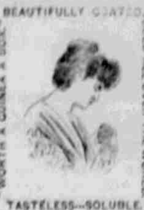
BEAUTIFULLY COATED. TASTELESS-SOLUBLE.

V mnoha městech, kde tento obřadný lék vešel v známost a byl kladně zkušěn, odstranil rodin. lékárnu v domácnostech a shledal byl dostatečným k vyléčení devíti setin obyčejných neduhů, jímž to poléhá: a když tak neduhy jež trvají měsíce a leta jsou vyléčeny, anž zmírňují v několika dnech, není to ku poště. Je Beecham's pilulky možná svou uznávanou pověst na obou polokoulech země. Stojí pouze 25 ct. ač vešle v příloze. "Je stojí za dobru krabička," an jedou krabička stojí často k dšpoře více než jedné dtky doktorských dštů. Ony