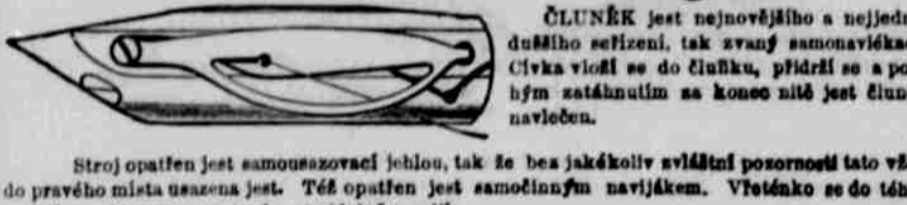
ČLUNĚK jest nejuvřobnější a nejjednodušší seřízení, tak zvaný samonavičák. Cívka vloží se do čluněku, přidrží se a pohybem zatáhnutím za konec nitě jest čluněk navlečen.

SVRŠEK, totéž žánr obsahující hlavní pracující část stroje, zapuštěn jest svou spodní plochou do stolu, tak že plocha se stolcem tvoří jednu rovnu.