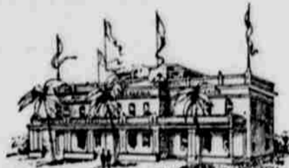
Budova území Utah, Nov. Mexika, Arizony a Oklahoma.

Čtyři území Utah, Nové Mexiko, Arizona a Oklahoma, uspořádají výstavku svou společně v jedné budově. Nedá se upříti, že bude to výstavka zvláště poutavá. Utah vystaví několik kmenů indiánských, Arizona pošle tam všeliké starožitnosti, Oklahoma předloží světu na odív své plodiny a ukázky zemědělství a Nové Mexiko ukáže své vzdělané Navajoes a Pueblos. Tři z těchto území mají nerostné prameny téměř stejné a okolnosti té použijí právě na prospěch své výstavy. Důlní ukázky a přírodní zjevy z těchto území budou tak sestaveny, že tvořiti budou pravou kouzelnou jeskyni krás přírodních, zejména stříbrná a zlatá ruda, zurit a jiné nerosty k výzdobě dotyčných síní budou použity.