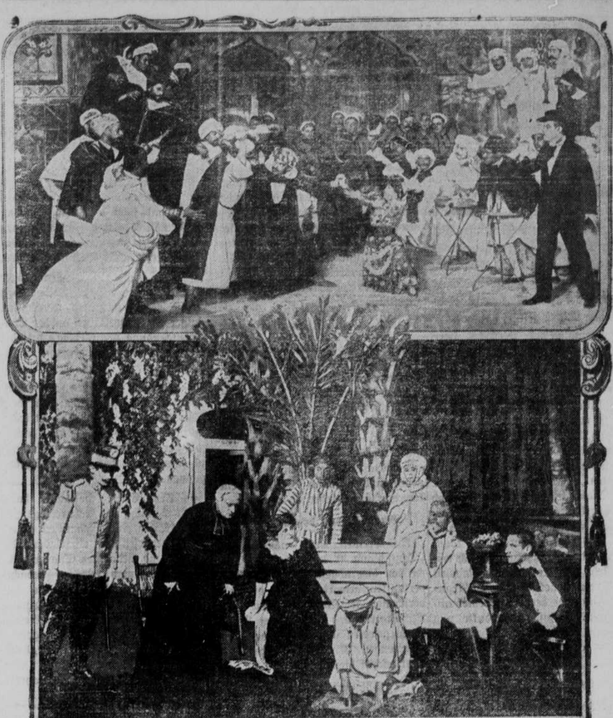
Szene in Liebler & C.'s großartiger Aufführung „The Garden of Allah“ im Vartensbach-Theater, am Donnerstag, den 1. Februar, im Vartensbach-Theater. Nur einen Abend. Der Kauf der Sige beginnt am Donnerstag, den 25. Januar, in Jessen's Apotheke.

Auch der grimmige Lloyd-George hatte sich nach Rom bemüht. Die heutige Kriegslage muß doch nicht so „unwesentlich und vorübergehend“ sein, wie sie in der den Friedensvorschlüssen der Mittelmächte abnehmenden Antwort der Alliierten hingestellt worden ist.