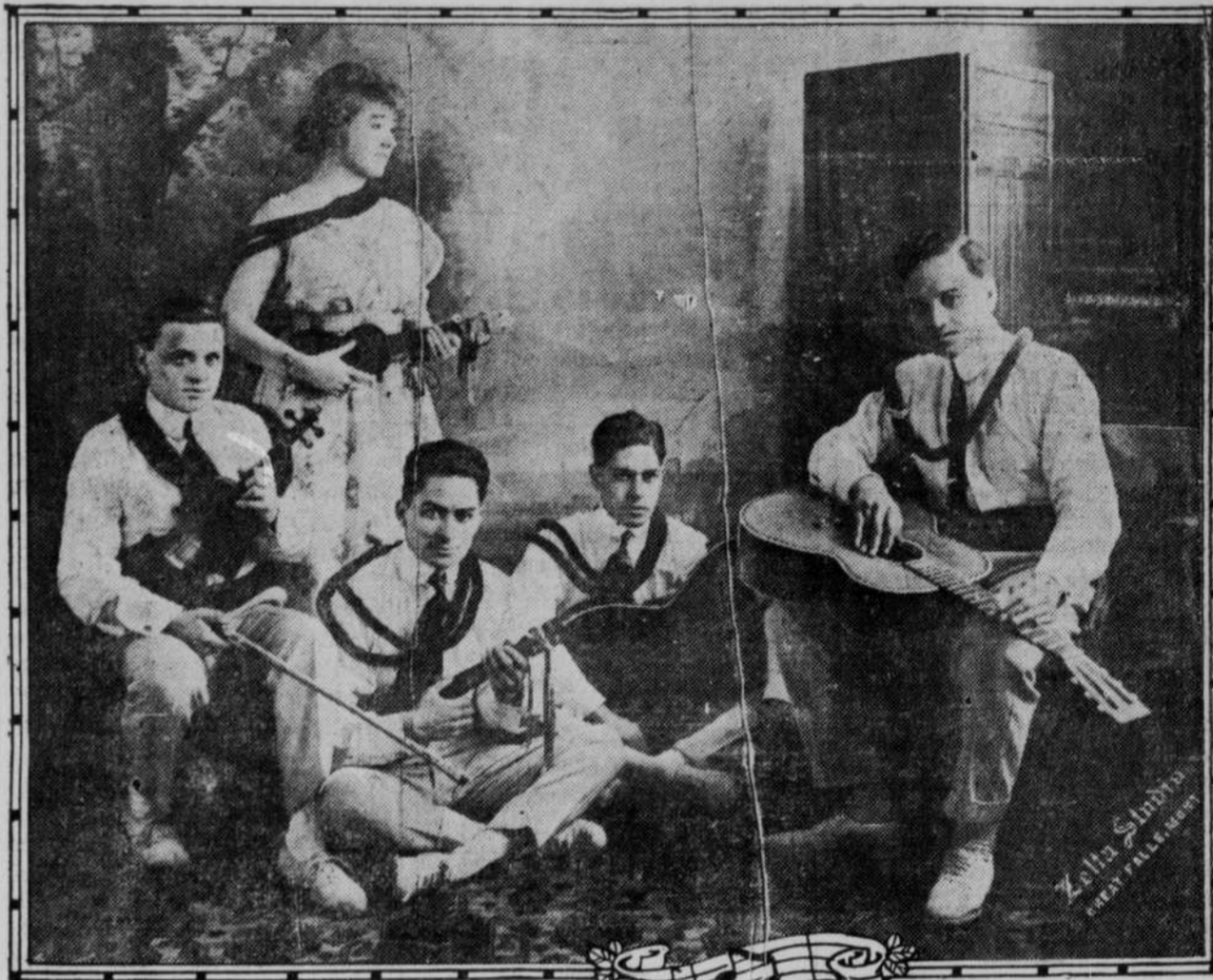
Five native Hawaiians recently from Hawaiian Islands. Sing English and native songs in native costumes, ukulele and steel players. To be heard first day of Chautauqua.

Presents Unique and Novel Program at Chautauqua