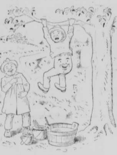
Lachen und Winkeln.