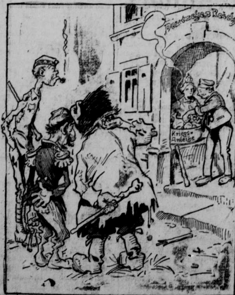
Na, wenn der sich immer noch mehr härt, kann's uns ja noch was gehen!