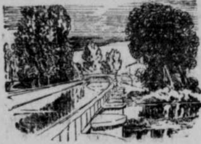
Kanalbrücke über die Marne bei Langres.