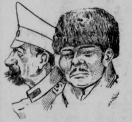
Russischer Offizier (links) und russischer Soldat (rechts) aus dem russischen Gefangenenerlager in Brandenburg a. O.