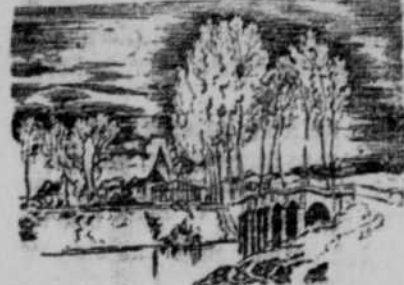
Die Marnebrücke bei Chalons.