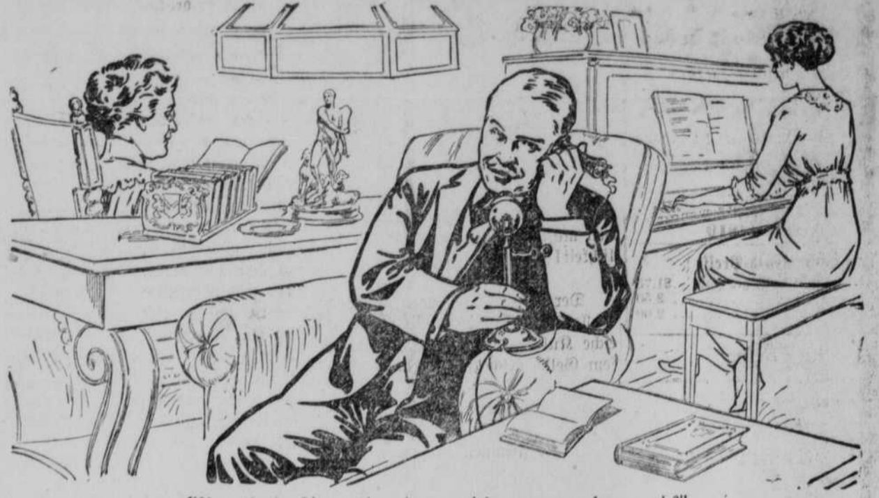
„Yes, that's Sis at the piano; wish you were home, eh?“

Beachtet Eure Adresszettel auf Eurer Zeitung. Wenn 1914 oder eine frühere Jahreszahl darauf steht, so ist Euer Abonnement bereits abgelassen oder wird in kurzer Zeit ablaufen.