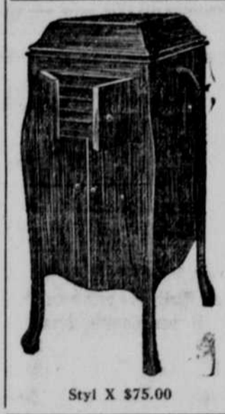
Styl X $75.00

Warten Sie nicht länger, sondern schicken Sie das Victrola heute nach Ihrem Heim. Das Victrola bringt Ihnen sämtliche Musik der Welt. Sprechen Sie heute vor und hören Sie Ihren beliebtesten Künstler auf einem Victrola. Bedingungen, die Ihnen passen werden.