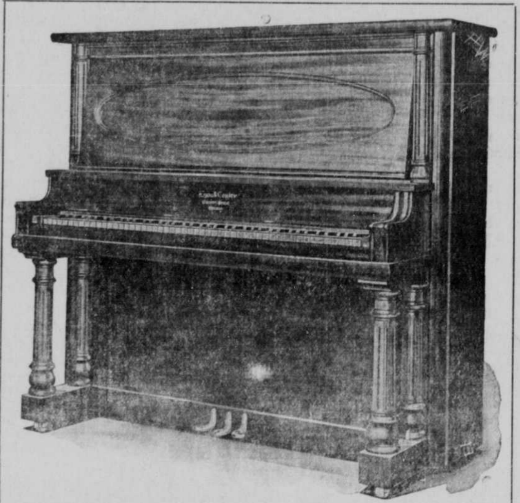
Zweiter Preis, $250 Wagner Piano.

Wer wird gewinnen? Sie oder jemand Anders?