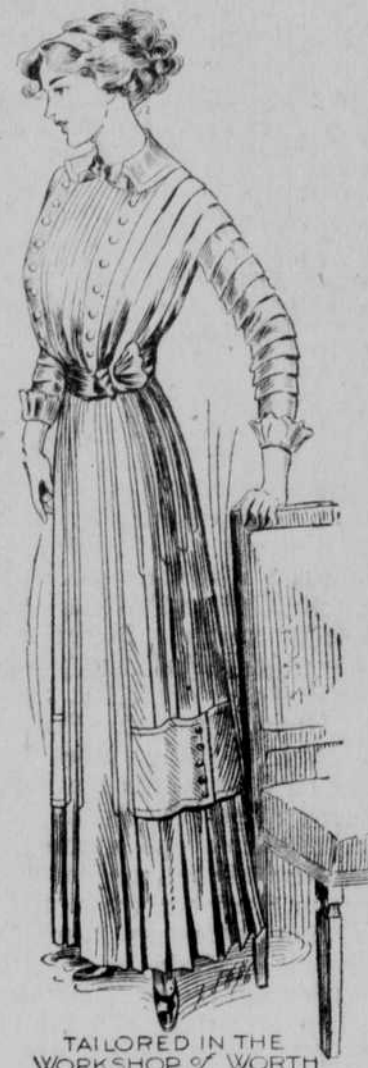
TAILORED IN THE WORKSHOP OF WORTH

$5.00, $6.50, $7.50, $8.50, $9.00, $10.00 und aufwärts.