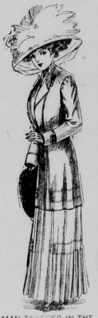
MAN-MADE IN THE WORKSHOP OF WORTH

Belze von Qualität zu niedrigsten Preisen hier. Tragt das „Gos- jard Corset“, sie werden born geschnürt. Preis $3.50.