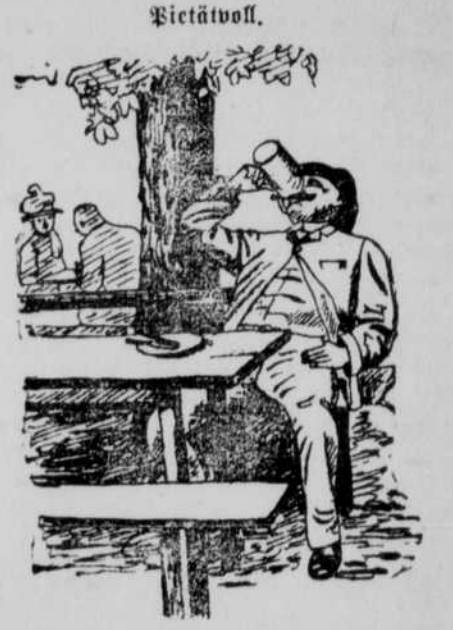
„Es ist wirklich schade, daß mein guter, seliger Onkel nicht mit ansehen kann, wie mir das Bier von seinem Geld schmeckt!“