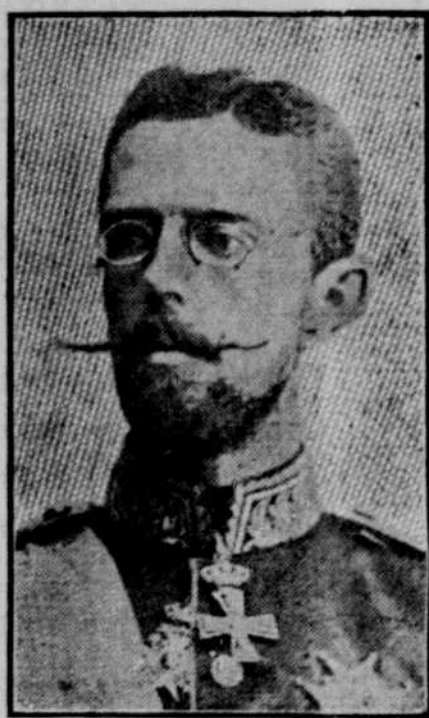
König Gustav V. von Schweden.

Stockholm, 9. Dec. König Oscar II. starb gestern Morgen um 9:10, umgeben von den Mitgliedern seiner Familie und den höchsten Staatsbeamten, die sofort, nachdem das Ableben des Monarchen von den Aerzten bestätigt worden war, eine Sitzung des Staatsraths einberiefen, in der der Kronprinz als neuer Herrscher proklamiert wurde. Er erklärte, nachdem er den Amtseid abgelegt hatte, daß er den Namen Gustav V. angenommen habe. Minister und hohe Staatswürdenträger leisteten dann dem neuen Monarchen den Treueid und dieser erließ sofort eine Prokla-