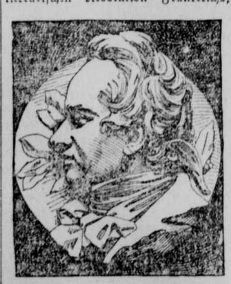
Medaillonportrait Victor Hugos.