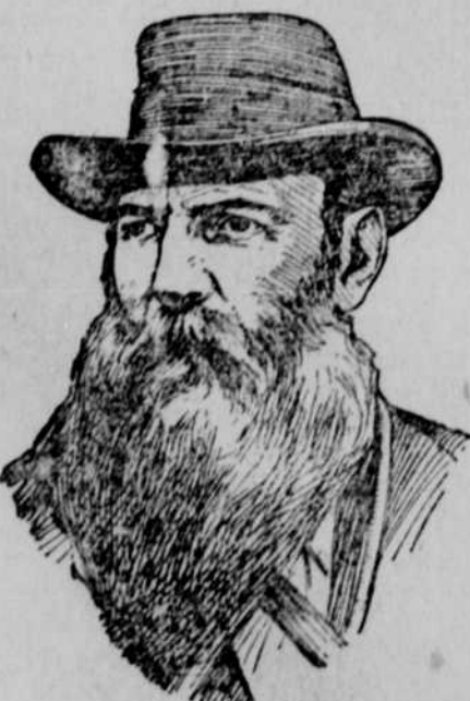
General Jacobus Henric Delarey.