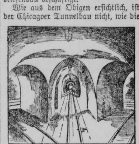
Tunnel am Kreuzungspunkte der Dearborn- und Jacksonstraße.

Bis vor Kurzem waren von der Chicagoer Tunnelanlage, die im Ganzen über 50 Meilen lang werden soll, fünf Meilen vollendet.