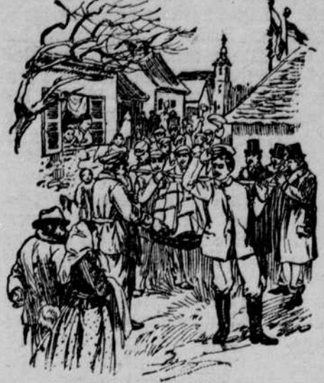
Umzug der Gesellschaften.

Um sich für die Entbehrungen der Fastenzeit gewissermaßen im Voraus zu entschädigen, kam schon im Mittelalter die Sitte auf, Faschnacht mit Trinken zu feiern.