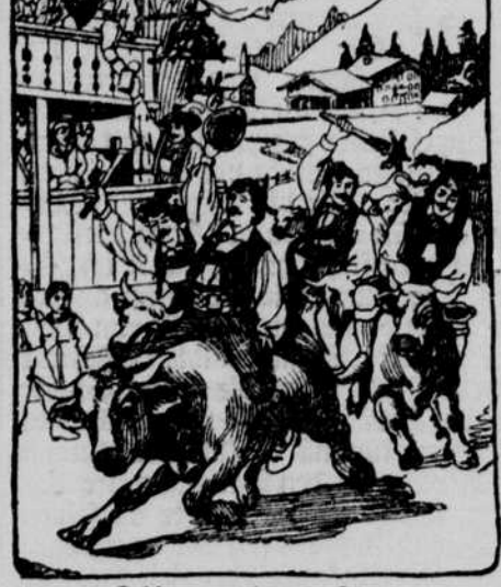
Ochsenwetreiben in Tirol.

Die Modedivine hat aus einem nur ihr bekannnten Grunde verfügt, daß Perlen wieder en vogue sein sollen. Dieser Befehl ist durch die ganze Frauenwelt gegangen und in diesem Erlaß kommt sie auf eine Mode zurück, die niemals wirklich in Ungnade war, seitdem die Menschheit überhaupt anfing, sich zu schmücken.