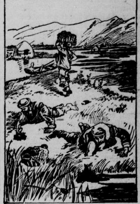
Die Lagunenfischer von Grado.

Die Temperatur um jene Zeit meist um den Nullpunkt schwankt, so ist die Arbeit nicht gerade angenehm, aber diese armen, abgehärteten und genügsamen Leute sind froh, zur Winterzeit überhaupt einen Verdienst zu haben, der sich einigermaßen lohnt und sie und ihre Familien erhält.