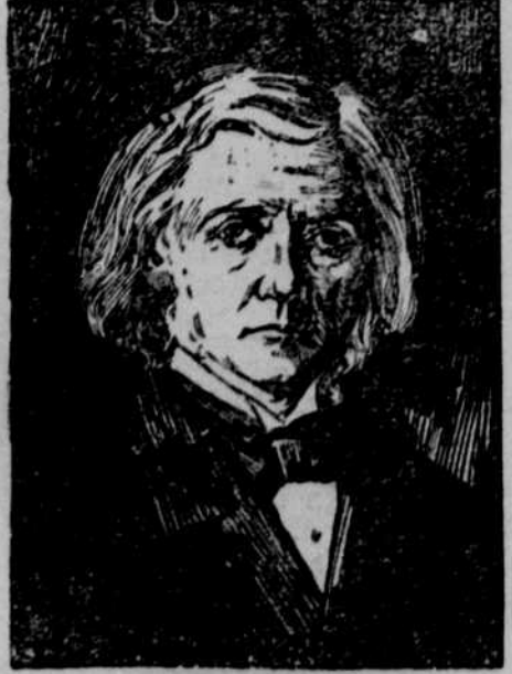
Dr. Georg Neumayer.

Unter der Leitung Neumayers hat sich die Seewarte bedeutend erweitert. Ihr jährliches Budget beträgt über 250,000 Mark, und das Personal umfaßt, neben dem Direktor, zehn nautische Gelehrte und zwölf Kapitäne, Ingenieure und Seeoffiziere.