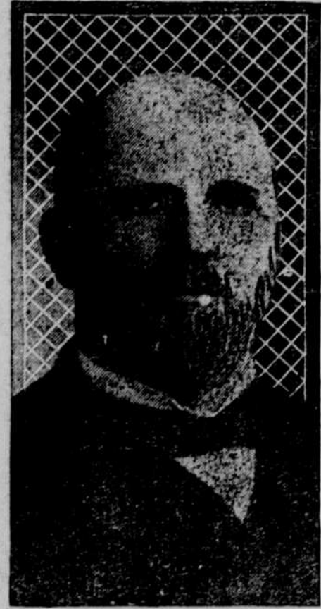
Ebenezer J. Hill.

Ebenezer J. Hill von Norwalk, Conn., ist einer der vier Repräsentanten des „Nutmeg“-Staates im Kongress und steht demalsten im 56. Lebensjahre.