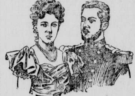
Prinz Albert von Flandern und Gemahlin.

Die nunmehrige Prinzessin von Flandern ist eine Tochter des bekannten Augenarztes und Philanthropen Dr. Herzog Karl Theodor in Bayern und seiner Gemahlin zweiter Ehe, Prinzessin Maria Josepha von Braganza, Infantin von Portugal.