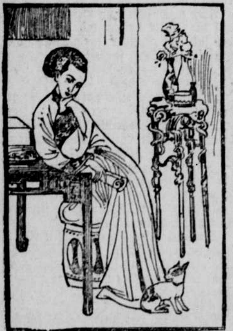
Die Kaiserin-Witwe nach dem Originalgemälde eines chinesischen Künstlers.

Man zählt in China acht Buzhong oder Hongsu, Generalgouverneure,