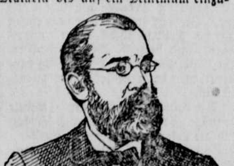
Professor Robert Koch.

Man erinnert sich vielleicht, daß der deutsche Reichstag seiner Zeit 60,000 Mark für eine Expedition des Gelehrten nach Deutsch-Neuguinea auswarf.