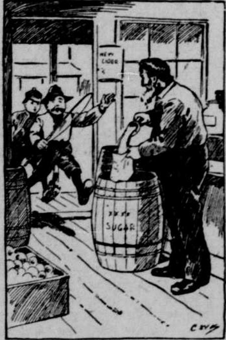
„Vater,“ rief Galy Bill, „die Bot Luder wollen uns unseren Vieren verzeihen!“