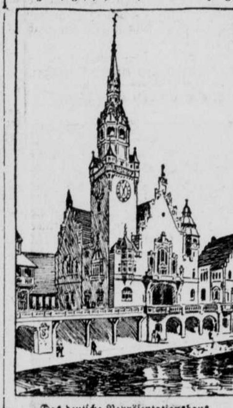
Das deutsche Repräsentationshaus.

Mit dem 200 Fuß hohen Turm, seinem reichen Giebelwerk und den feilragenden Dachern ist seine Erscheinung schon jetzt eine charakteristisch-deutsche. Der Turm erhält eine theilweise patinierte Kupferbedachung, die Hauptfronten sollen waldrich geschmückt und die Dächer mit Ziegeln in kräftigem Roth gedeckt werden. In Ausführung von Beschlüssen, welche persönlich vom deutschen Kaiser gefaßt wurden, sollen die im Hauptgeschloß nach der Seine zu ge-