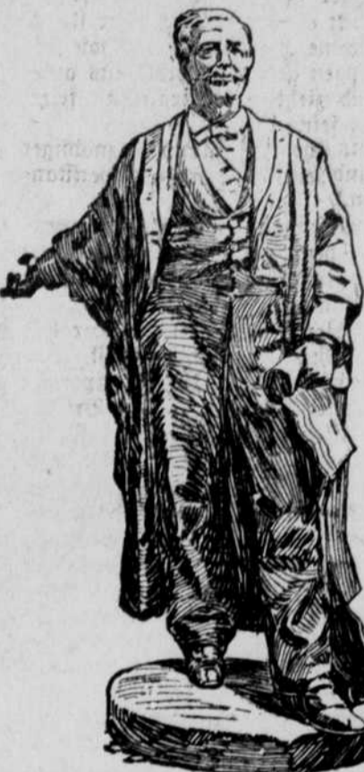
Das Leseps-Monument in Port Said.

Auf der Mole von Port Said, dem Ausgangshafen des Suezkanals am Mittelmeer, wo vor 40 Jahren der erste Spatenstich zu dem gigantischen Werke erfolgte, ist dieser Tage ein von G. Fremiet modelliertes Denkmal für Ferdinand Leseps enthüllt worden. Die über 25 Fuß hohe Bronzefigur, deren