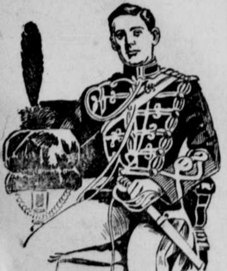
Lieutenant Winston Churchill.

An ankündenden Krankheiten sterben in Frankreich rund 240,000 Personen im Jahre.