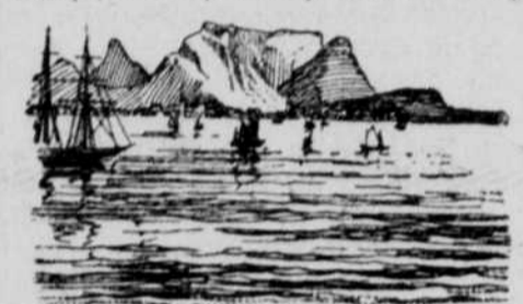
Kapstadt und die Tafelbai.

Kriegsfall aus besonders zu diesem Zweck ausgebildeten Leuten der Infanterie aufgestellt. Jede Kompanie besteht dann aus vier Zügen zu je einem Offizier und 32 Mann. Die britischen Infanteristen behalten die Uniform und Ausrüstung ihres Bataillons, tragen indes statt der dunkelblauen Hosen Reithosen von starkem hellbraunen Tuch