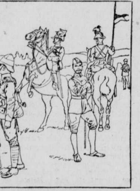
Träger. General. Reitender Schütze und Mann von Neu-Südwales. Britische Infanterie. Schütze. Führeroffizier. — Südwales. Typen der englischen Armee in Südafrika.

Unser größtes Bild bringt einige Typen der in Südafrika zur Zeit beliebtesten englischen Truppen, wozu hier bemerkt werden mag, daß die britische Infanterie eine ganz eigentümliche Einrichtung der britischen Armee ist. Diefelbe existiert im Mutterland als geschlossener Truppentörper im Frieden überhaupt nicht, sondern wird erst im