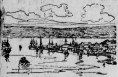
Der Hafen von Durban.

Je mehr Truppen die Engländer in Südafrika landen, desto mehr scheinen ihre Aussichten, den Feind durch die Übermacht zu erdrücken, zu wachsen und desto gehobener wird die Stimmung im Mutterlande. Tatsächlich liegen auch jetzt noch manches „aber“ und manches