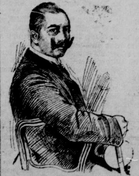
Wilhelm der Zweite.