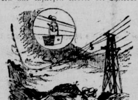
Drahtseilbahn über den Schilfoothpaß.

Die Reise nach Klondike via Schilfooth-Paß hat schon jetzt die Hälfte ihrer Sachgaben verloren!