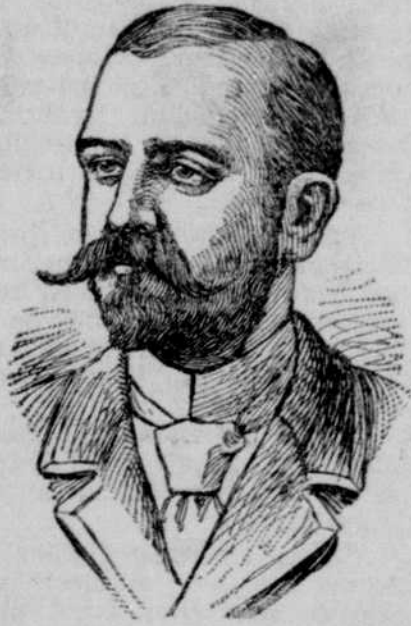
Enrique Dupuy de Lome.