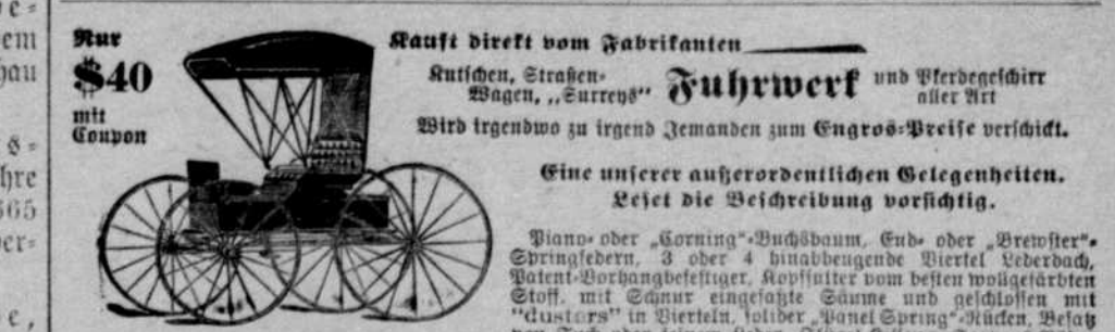
No. 120 Top Buggy. 245.00 ist unter bester Engros-Preis für dieses feine Wagn.

Um die Kundtschaft der Deutschen von Grand Island und Umgegend wird ergebnst gebeten.