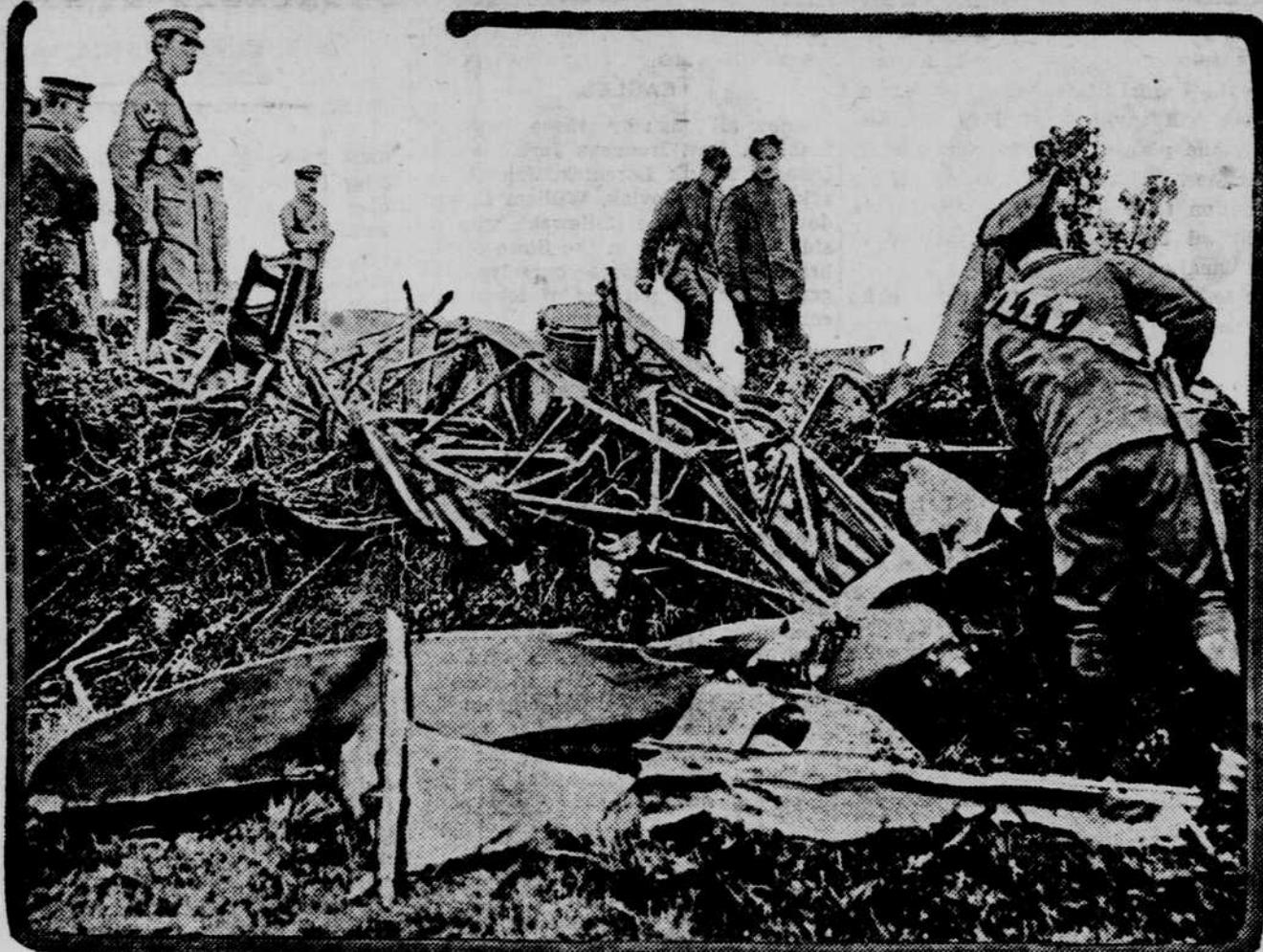
The wreckage of the Zeppelin brought down by Lieut. Leete Robinson near Cuffe, England. The encounter between the great Zeppelin and the aeroplane took place about 12 miles from London. Lieutenant Robinson in his aircraft boldly assailed the invader with machine gun and fire bombs and sent it crashing to the earth. The crew of the airship were buried with full military honors. Lieutenant Robinson received the Victoria Cross for his daring exploit.