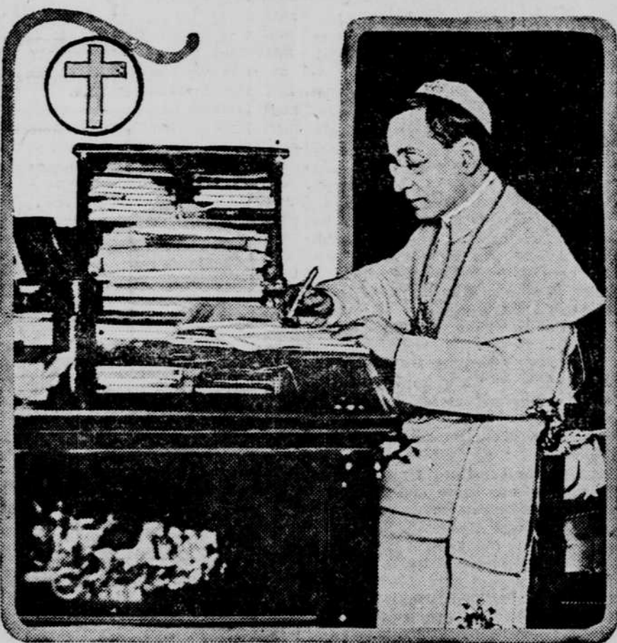
This photograph of Benedict XV was taken September 3 on the second anniversary of his elevation to the papal throne.