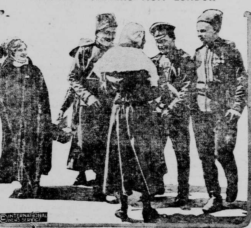
A trio of the czar's husky fighters, wearing many decorations attesting their bravery, aiding the British Red Cross by the purchase of St. George's flags in the Strand, London.